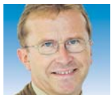
Von Stefan Vetter

Dabei ist das deutsche Gesundheitswesen sehr wohl reformbedürftig. Eine sinnvolle Reform müsste aber Ausgaben und Einnahmen gleichermaßen im Blick haben. Die Regierung konzentriert sich lediglich auf letzteres. Und nicht einmal da hält sie, was der Kommissionsauftrag verspricht. In der Koalitionsvereinbarung ist ausdrücklich vermerkt, dass der Arbeitgeberanteil beim Beitrag eingefroren werden soll. Was das mit einer „sozial ausgewogenen Finanzierung“ zu tun hat, bleibt ihr Geheimnis. Nun lässt sich zweifellos über eine Gesundheitspauschale diskutieren, bei der die Sekretärin den gleichen einkommensunabhängigen Beitrag bezahlt wie ihr Chef. Genaue betrachtet ist das sogar gerechter als jetzt, denn der not-